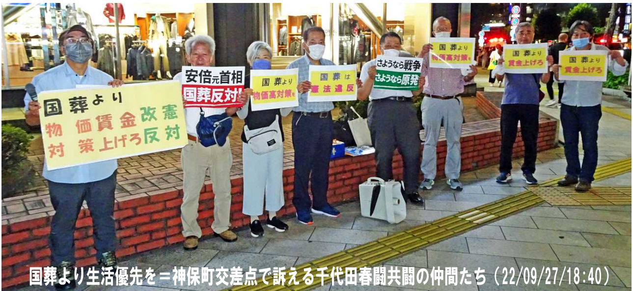
国葬より生活優先を＝神保町交差点で訴える千代田春闘共闘の仲間たち (22/09/27/18:40)

しばらくご無沙汰していました。「区労協通信」の発行です。今回のテーマは見出しをお読みいただいたように、アベ元首相の「国葬」問題の写真報告です。