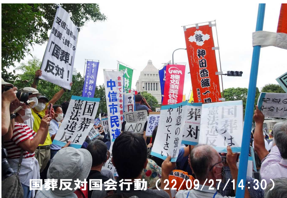
国葬反対国会行動 (22/09/27/14:30)