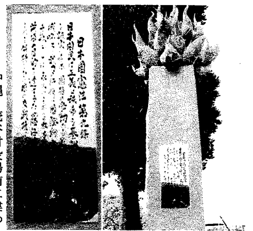
沖繩・読谷村役場前に建つ「憲法九条の碑」

人間の欲望から発する戦争に対し、我々の中には生来の生きることへの願望がある。すべての生命が当たり前にその一生を終えることができるとして、平和なうちに生命を次へとつなぐことのできる社会こそ私たちの願ひ。その社会の実現を信じよう。我々自身の力を信じよう。世界中が9条の精神で満ちることを信じよう。それは誰にも阻止できない植物の萌芽と同じ、生命の躍動につながるのだから。