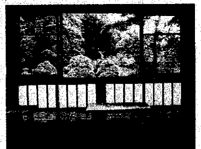
松聲閣の中から庭園をのぞむ

所在地：文京区目白台1丁目1番22号 ◇ ▲ ●開園時間 (2月~10月) 9:00~17:00 入園は16:30まで (11月~1月) 9:00~16:30 入園は16:00まで ●休園日：12月28日から1月4日