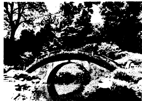
園内の見どころの一つ円月橋

れています。特別史跡と特別名勝の重複指定を受けているのは、都立庭園では浜離宮恩賜庭園と小石川後楽園の二つだけで、全国でも9ヶ所だけです。 ◇ ◇ 今の時期はハナシヨウブ、スイレンが咲きます。ただし、6月17日は少々見ごろを過ぎていられるかもしれませぬ。