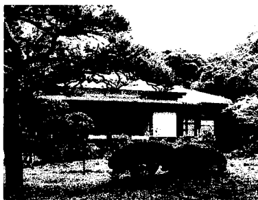
小石川後楽園内「涵徳亭」

総会に合わせて、小石川後楽園内の散策と、総会参加者による懇親会を行います。 総会、懇親会ともに密状態にならないなどの感染対策を施します。 庭園内散策は総会が始まる前に、懇親会は総会終了後に行います。